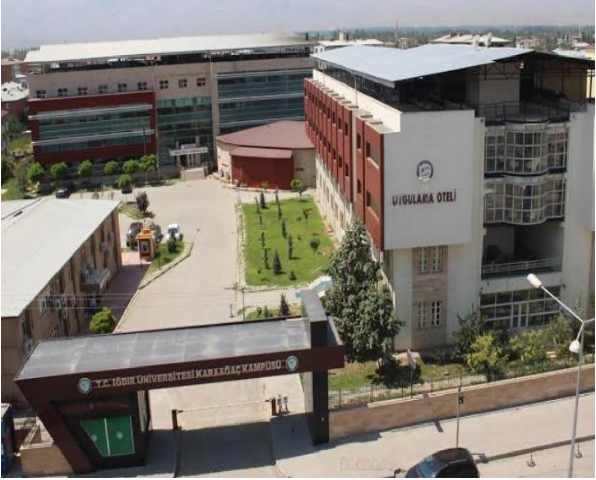
(Şekil 1): İğdir Üniversitesi Karaağaç Kampüsü